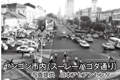
ヤンゴン市内(スレーパゴダ通り)

2010年11月、新憲法に基づく総選挙が実施され、スー・チー氏の自宅軟禁も解除。翌年テイン・セイン大統領の就任により、ミャンマーは民政移管を果たし、今後さらなる民主化に向けて注目されています。