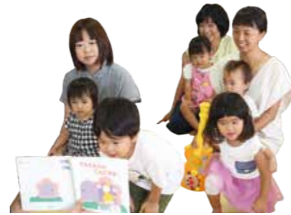
楽しいおはなしタイム

ママと一緒にのおはなしタイムやお誕生会、親子で遊ぼう、子ども発達相談員（保健師・臨床心理士）による相談など毎月の行事や、親子制作やハッピー3世代交流会などの季節の行事などもあります。 赤ちゃんがハイハイできる量のスペースや授乳スペースも用意していますので、皆さんお気軽にお越しください。