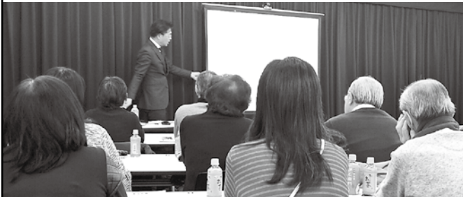
3,998人が参加済みの人気セミナー。他では手に入らない情報が得られます。

3,998人が参加済みのセミナー 業者選びのポイントを詳しく解説 10月は塗装を考える人が増えます。しかし、「業者の見極め方がわからない」「費用相場は？」などの疑問や不安が絶えません。事後全く来てくれない...という声も。 そこで創業51年地元企業のユーコーコミュニティーでは、「失敗しない塗装セミナー」を、二宮町民センターで開催。 信頼できる会社の見極め方や品質を保つ正しい工事項目など、業者選びのポイントを分かり易く解説します。このセミナーで失敗しない塗装のコツがわかります。 先着15組限定なので、お申込はお早めに。