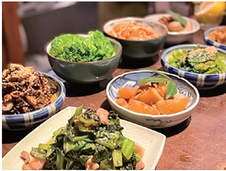
茶屋町カフェ Chaya-Machi Cafe