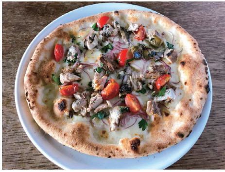
大磯迎賓館 Oiso Geihinkan