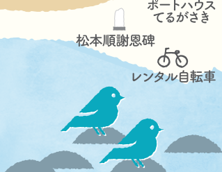
アオバト集団飛来地