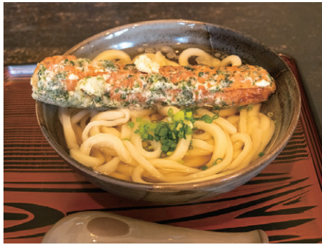
讃岐うどん 讃州 Sanuki Udon Sanshu