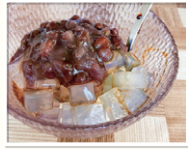
食事 喫茶 風月