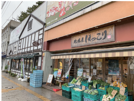
地場屋ほっこり Jibaya Hokkori