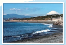
照ヶ崎海岸から見える富士山