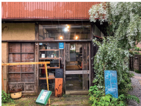
つきやま Arts&Crafts Tukiya