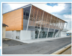
大磯港賑わい交流施設 (OISO CONNECT)