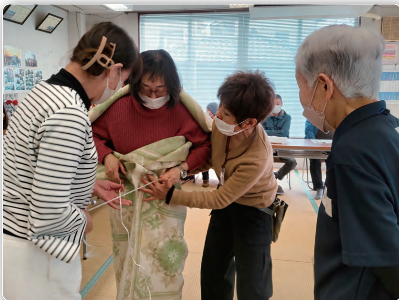
● 防寒のガウンづくり