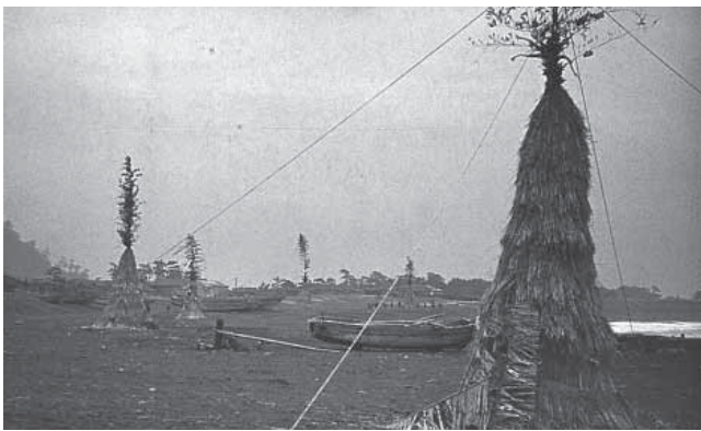
▲国指定無形民俗文化財 大磯の左義長 昭和30年頃のサイトの設置風景