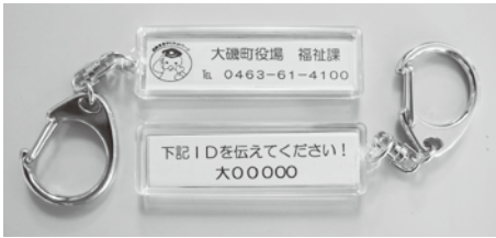
▲はいかいSOSキーホルダー