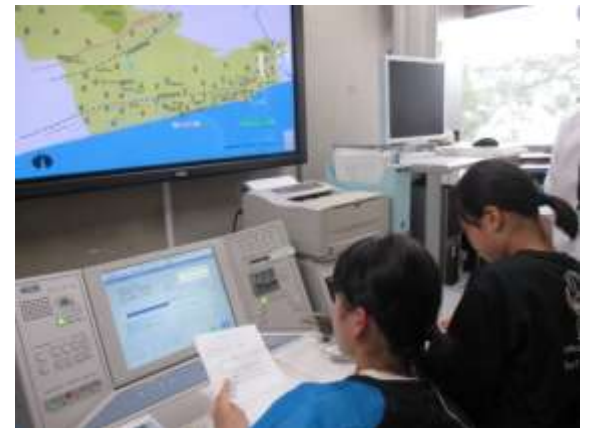
予告放送録音の様子